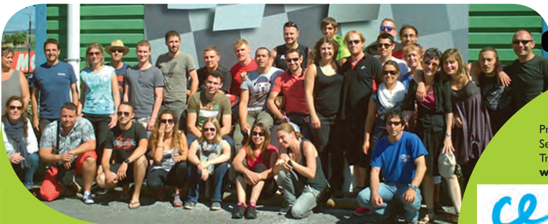
Le Team Kartcopter