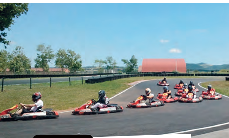
Tous en course