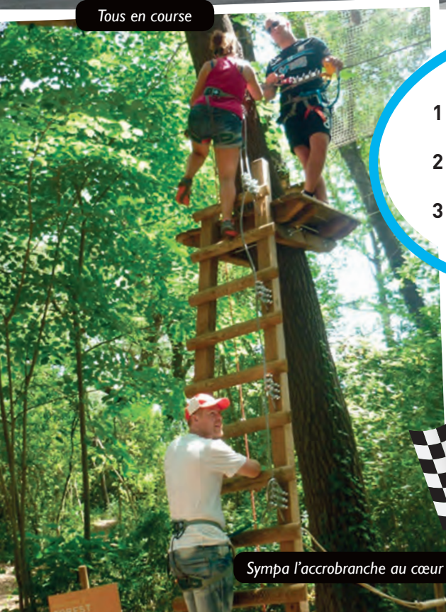
Sympa l'accrobranche au cœur des Cévennes

Bravo à tous pour cette course magnifique ou le fairplay et la régularité ont été les maitres mots.